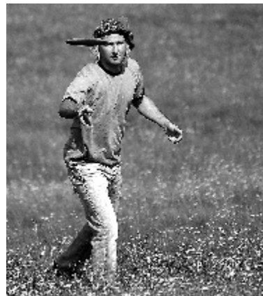
En frisbeespelare i aktion.

Frisbeegolf där 50 deltagare hade anmält sig och gick en 9 hålsbana runt Angereds natur. Ett mycket uppskattad tävlingsgren där den lilla frisbeen inte gick dit man ville alla gånger.