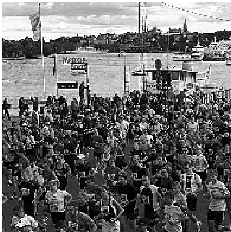
Det var många som ville fram genom Stockholms vackra omgivningar.