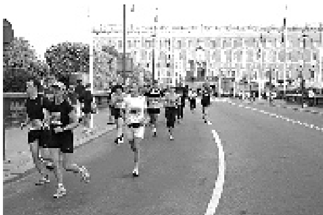
I full fart genom Stockholm.