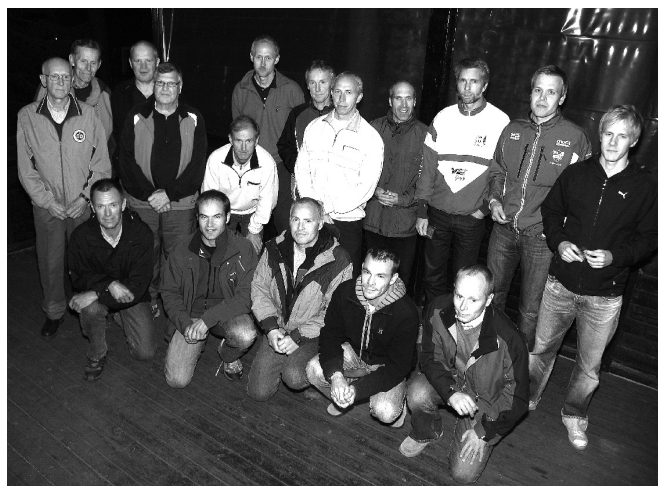
En samlingsbild på deltagarna som var med i Norrköping